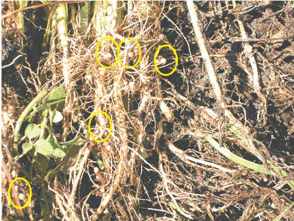
Foto 2. Raíces de Mungo con abundantes nódulos, 30 días después de sembrado

la siguiente fotografía se aprecia la formación de nódulos causados por estas bacterias en las raíces de las plantas de mungo.